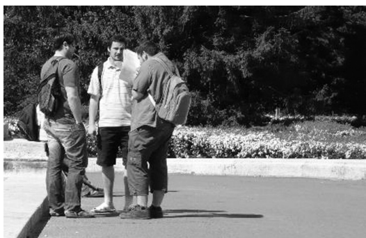
2. és 3. ábra: A bölcsészhallgatók öltözetének illusztrációja

A második megfigyelés az elsőhöz hasonló körülmények között zajlott a Kassai úti TEOK előtt, a koradélutáni órákban, tizenkét óra és délután két óra között; az idő kellemes meleg volt. A megfigyelt hallgatók többnyire csoportokban álldogáltak vagy