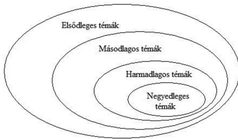
6. ábra: A csoport kommunikációjának szerkezete

közös alapot nyújthat. Ezt a hipotézist azonban a megfigyelésem során szerzett tapasztalatok nem támasztották alá. Ugyanis a csapattagok – figyelembe véve azt is, hogy nem tartoznak a csapaton kívül másik, zenei ízlés alapján szerveződő csoporthoz, csupán fogyasztói a kultúra ezen ágának – nem képviselnek homogén zenei ízlést. Sőt, az általuk preferált zenei stílusok is elég széles skálán mozognak: a hip-hopot és rapet kedvelőktől a techno zenét szeretőkön át rockot hallgatókkal bezárólag sokféle stílussal találkoztam. A zenei ízlés a csoporton belül nem jelent meg külön csoportszervező tényezőként. Az eltérő zenei ízlésből fakadó eltérő szórakozóhelypreferenciákat kompromisszumos megoldással hozzák közös nevezőre: pubokat, kocsmákat látogatnak együtt iszogatók, de elsősorban beszélgetés céljából. Gyakran rendeznek házibulikát is – ez (kollektíven) általában havi rendszerességgel történik –, vagy (ha az időjárás engedi) a megfigyelési alkalomhoz hasonló sütéseket. Megszokott szórakozási formának számít még a közös meccsnézés, amit heti vagy kétheti rendszerességgel szerveznek. Az éjszakai kimaradások nem túl gyakoriak a körükben, amit életmódjukkal (edzések, mérkőzések, egészség) indokolnak. Többségük az összejövétel során sem fogyasztott nagyobb mennyiségű alkoholt, azonban – számomra eléggé meglepő módon – a csapatnak közel egynegyede dohányzott, és, mint kiderült, rendszeresen is dohányoznak.