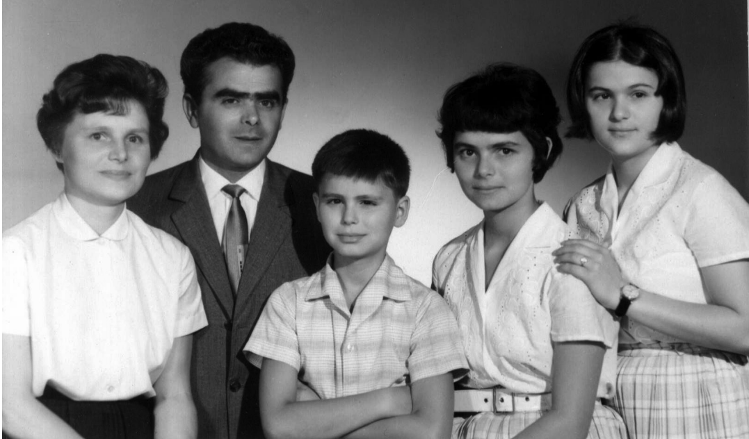
Újra együtt a család 1964

Azonban túl szűkös volt a hely a mi tüzes Vasas sárkányunknak, és félteni kezdem őt, nehogy megsérüljön a szekrény sarkán. Nem sérült meg, de én már tudtam, nem hogy a villadrótok fölé, hanem az égis fog másnap repülni. Így is lett.