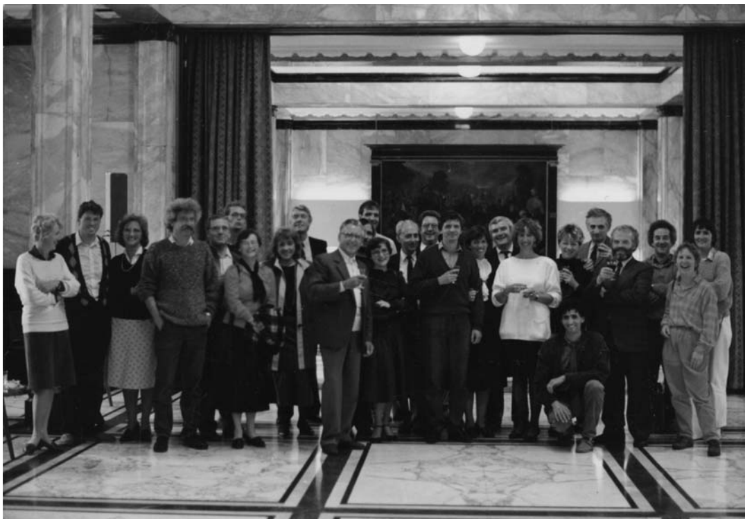
Magyar-holland felnőttoktatók találkozója Leidenben, fogadás a városházán 1988-ban.