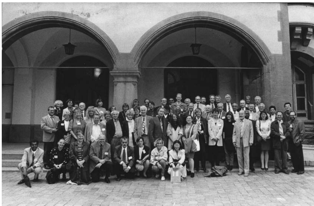
Nemzetközi felnőttoktatási konferencia Jénában 1996 szeptemberében a Friedrich Schiller Egyetemen

Az erdei környezetben, hangulatos helyen épített népfőiskolán reggelenként kiosztottak egy énekes-könyvet, abban népdalok voltak, kottával, szöveggel. Különböző országok népdalait tartalmazta ez a könyv, az amerikai spirituáléktól kezdve a magyar népdalokig. Kérték a jelen levőket, hogy együtt énekeljék el a kijelölt dalt, és ezzel alapozzák meg a hangulatot az utána következő előadások meghallgatására. Ezek a beszámolók arról szóltak, hogy az egyes országokban hogyan használták fel a gyakorlatban a grundtvigi hagyományt. Az utolsó nap programja más volt: látogatás a „szomszédságban”. Nem tudtam, mit jelent ez. Kiderült, hogy hárman-négyen ülünk be egy autóba, s az elviszi utasait a környék valamelyik gazdaságába. Ahová mi kerültünk, egy hatvan holdas gazdaság volt, ahol a tulajdonos cukorrépát termelt, s mellékesen szarvasmarhákat is tartott. Az egész gazdaság gépesítve volt, azt alkalmazottak nélkül a gazda és a felesége művelte. Beszélgetésünket a házigazda lánya tolmácsolta, ő angol-német szakos tanár volt egy középiskolában. A gazdaság bemutatása után megnéztük a házi könyvtárat, amely nemcsak könyveket tartalmazott, hanem folyóiratokat is, amelyekre előfizettek. Azzal búcsúztunk el tőlük, hogy este a népfőiskolán ismét találkozunk. Ott a vacsora után a délutáni házigazdánk azzal lepett meg bennünket, hogy elmondta, ő ennek a népfőiskolának elnök-