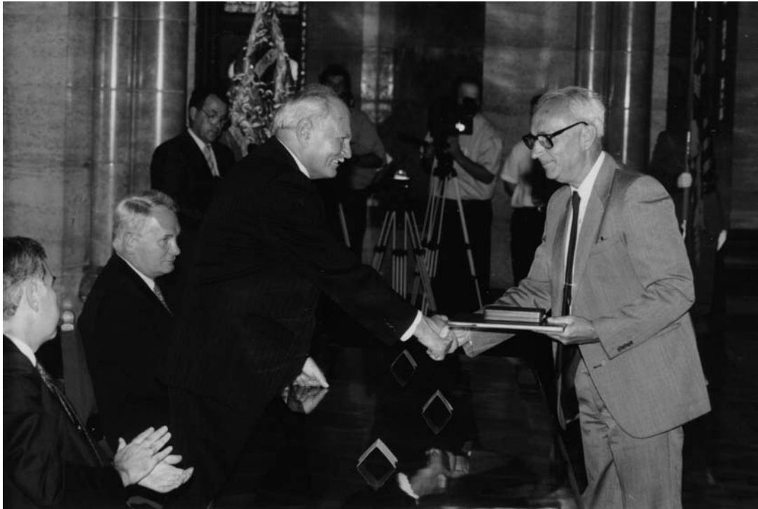
Göncz Árpád átadja a Köztársasági Érdemérem Kiskeresztjét a Parlamentben 1995. augusztus 19-én.