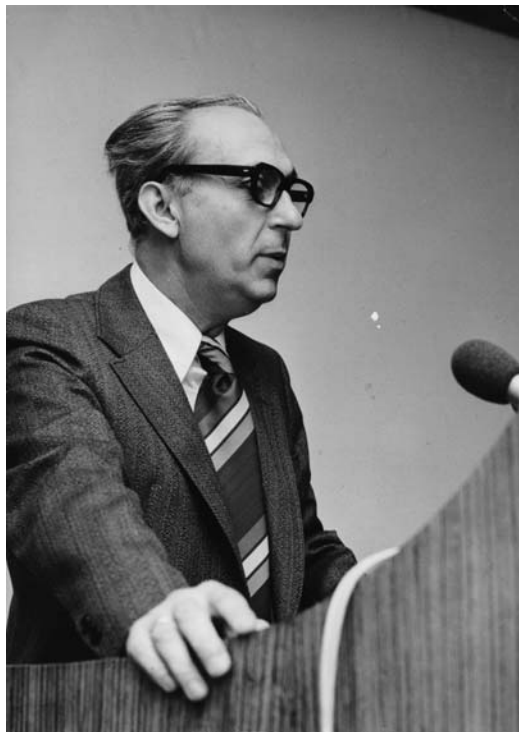
1977. november 29. a berlini Humboldt Egyetemen

1982-ben részt vettem egy rendkívül érdekes nemzetközi találkozón, Dániában. Ekkor ünnepelték a népfőiskolai mozgalom megalapítója, Nikolaj Frederik Severin Grundtvig születésének kétszázadik évfordulóját. Az egyhetes rendezvényre másod-