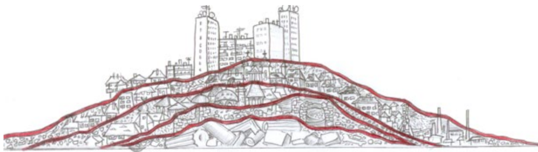
1. ábra Korok, értékek, rétegek