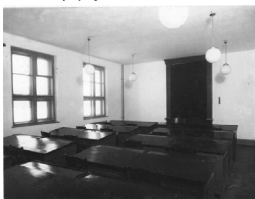
Sárospataki Ref. Főiskola - Angol-Internátus. (Tanuló-szoba.)