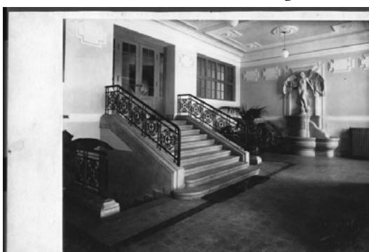
Sárospataki Ref. Főiskola. Gimnáziumi Angol-Internátus. (Előcsarnok. Falán a főiskola gyapaból öntött címere, a balta ivófej.)