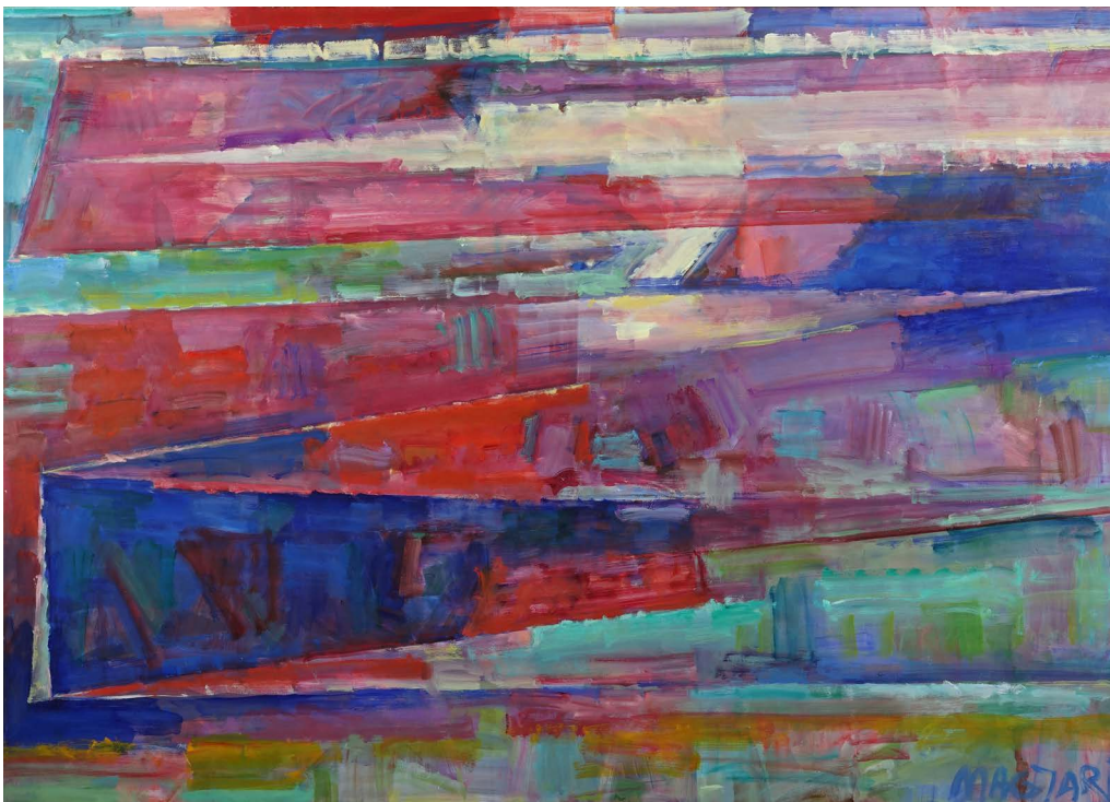
Távoli partok-2 111 x 155.5 olaj, vászon (2022)