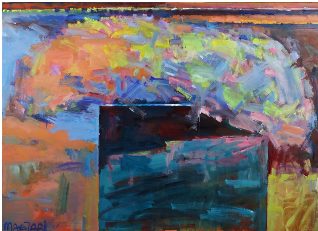
Nagy felhő -I. 110 x 154 olaj, vászon (2022)