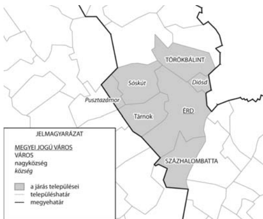
1. ábra Az Érdi kistérség

A térképet készítette: Czirfusz Márton (2013)