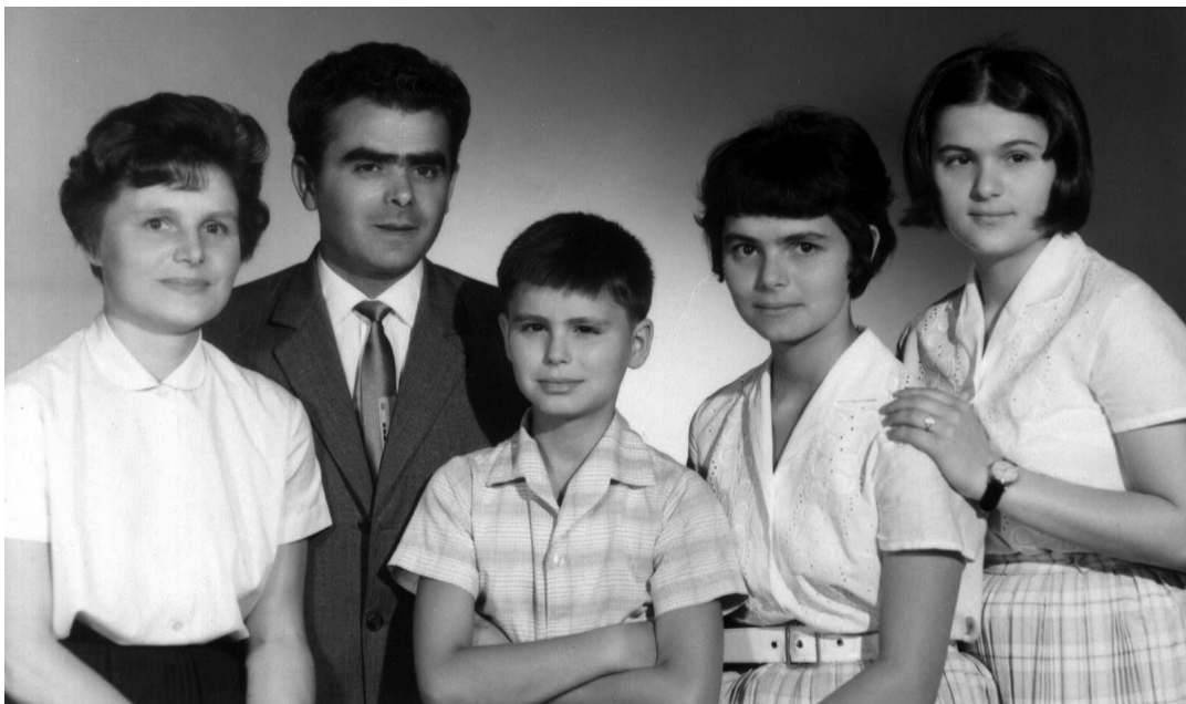
Újra együtt a család 1964

Azonban túl szűkös volt a hely a mi tüzes Vasas sárkányunknak, és félteni kezdem őt, nehogy megsérüljön a szekrény sarkán. Nem sérült meg, de én már tudtam, nem hogy a villadrótok fölé, hanem az égis fog másnap repülni. Így is lett.