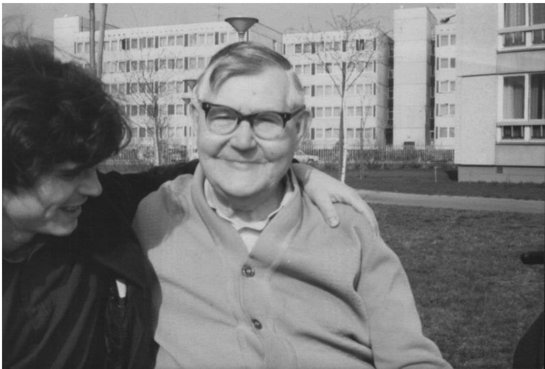
Én és a nagyapám 1989, a kép 1 hónappal nagyapám halála előtt készült