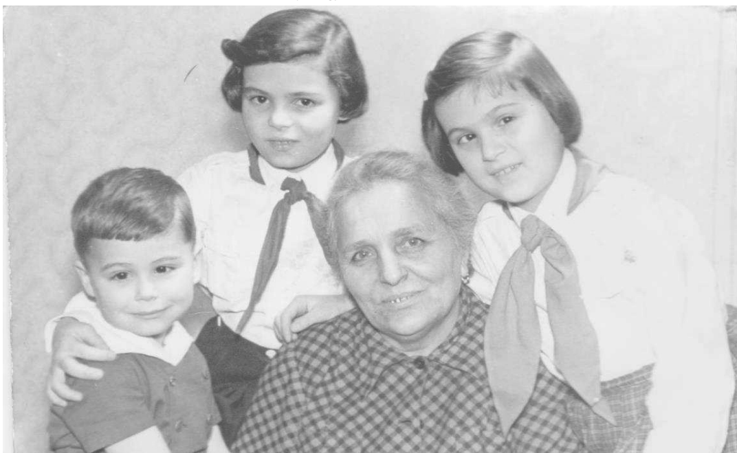
Egy kisdobos, egy úttörő, egy nagymama és egy óvodás 1959