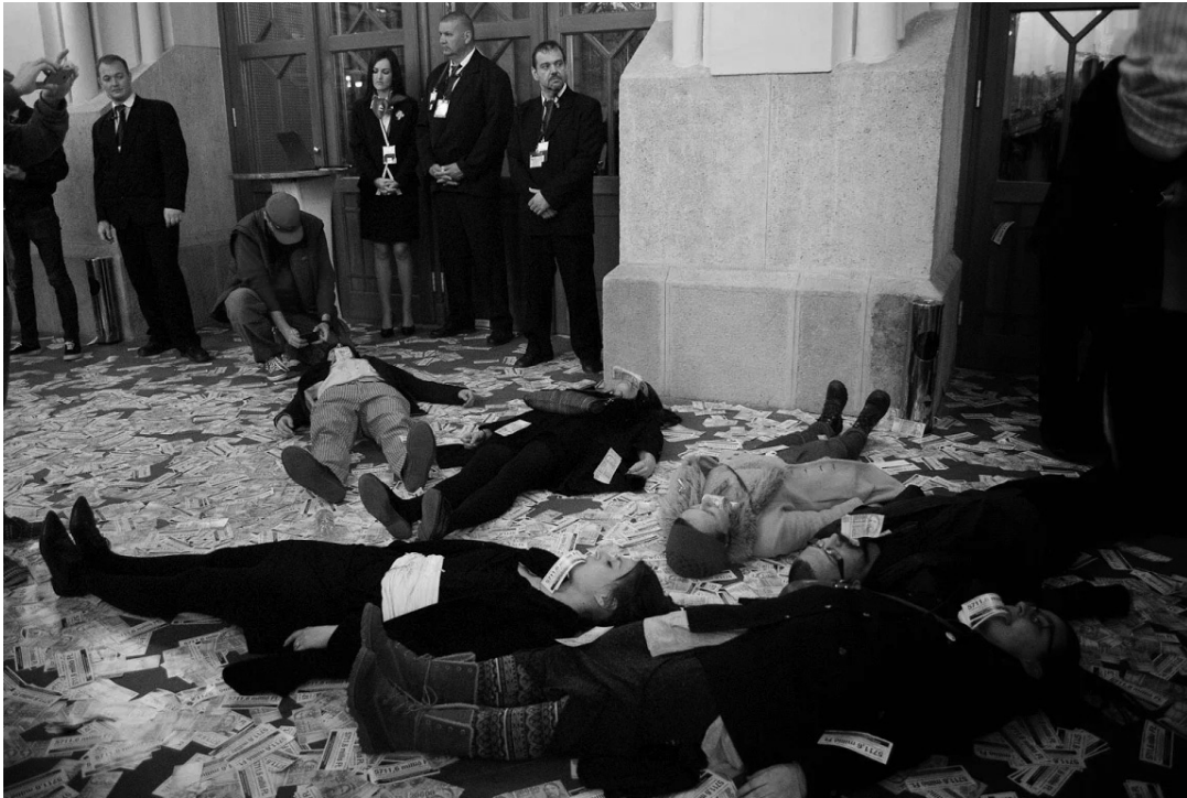
Kép 1. - Pénzeső a Vigadónál akció dokumentációja, 2014.03.15.