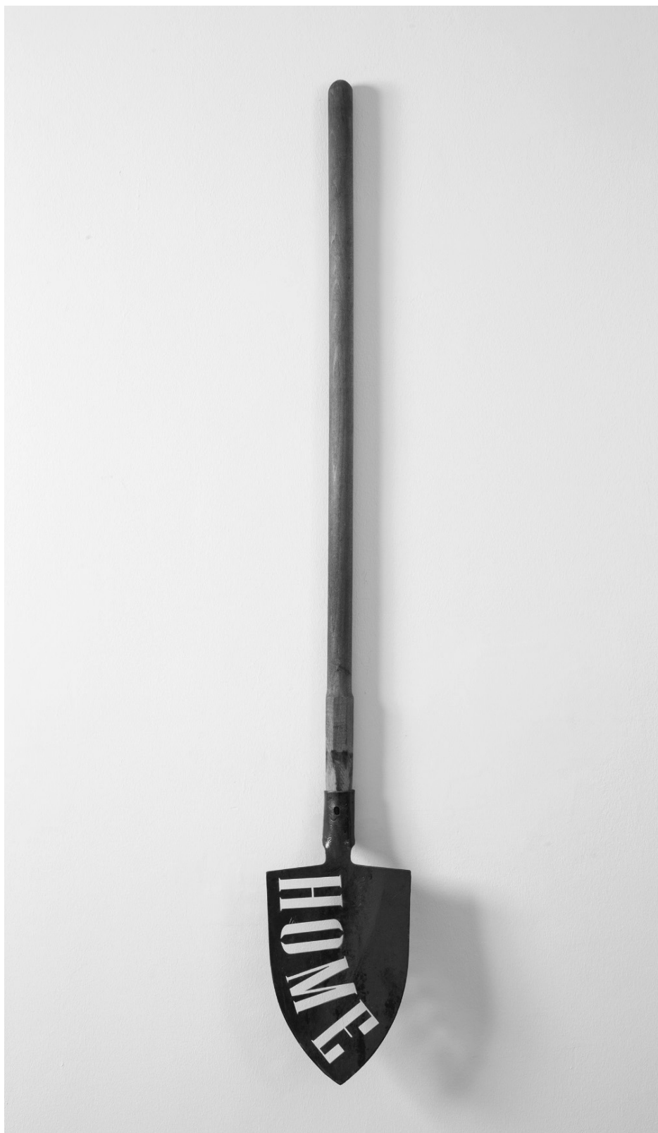
Kép 4. Eperjesi Ágnes: Home , object 2016.